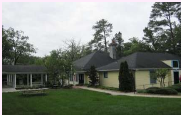
広い敷地に美しい建物・ラーニングサービス

「ラーニングサービス」は、リハビリテーション付きのグループホームといった感じのもの。脳損傷の方々、十数名が日常生活の支援を受けながら、作業療法士、言語聴覚士、カウンセラー等と個別に必要なリハビリにも取り組んでいる様子を見せていただきました。支援スタッフと地域活動に出かけている人もいました。薄暗くした個室に案内されると、重い脳損傷の若者が2名横たわっていました。案内の人は「ここに来て、経管栄養から口で食べる方に切り替えられたのよ」と言いました。そんな重度の