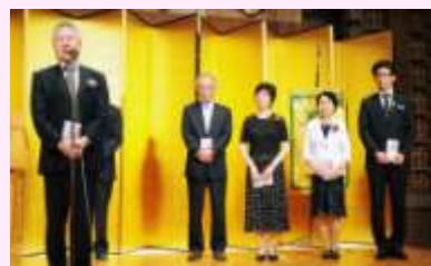
東京パイロットクラブの寄付金贈呈式

6月25日、東京パイロットクラブの60周年記念式典が港区の帝国ホテルで開かれました。当クラブは、戦後まもない1951年に発足、今日までボランティア活動を続けてこられました。サークルエコーは、2002年暮れの定例会で高次脳機能障害の解説のためにお呼びいただいたのがおつきあいの始まりで、翌年6月、四谷区民ホールでの「脳を守ろう」キャンペーンのシンポジウムではパネリストのひとりとして、サークルエコー会員の特徵などについてお話しする機会をいただきました。次の年から、エコーの会員やサポーターたちは毎年、「全国統一パイロットウォーク」に参加、都内各所をクラブの皆さんとご一緒に歩いています。