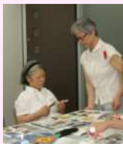
「花を切り取りました」