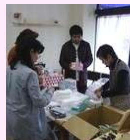
東日本大震災関連の 支援物資の仕分け作業