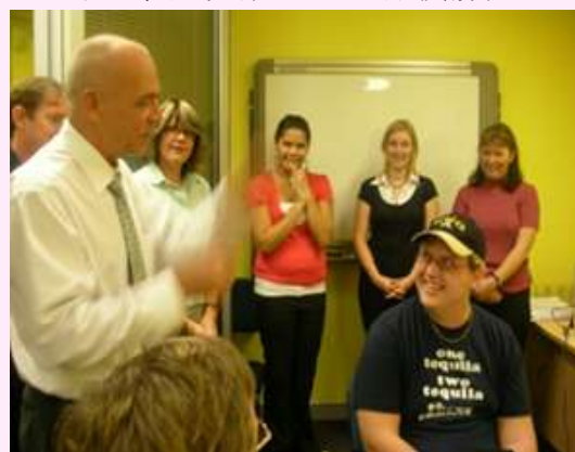
BIAQのスタッフと利用者の青年

1984年に東岸のクィーンズランド州ブリスベンで脳損傷者の家族たちが立ち上げた「ヘッドウェイ」は10年後にはクィーンズランド脳損傷協会(BIAQ)としてパワーアップ、州政府による「脳損傷者アウトリーチ型支援(ABIOS アビオス)」の設立(1997年)などにもつながっていきました。ABIOSは専門のスタッフが脳損傷者の家庭に出向いて、相談/支援を提供するというもの。車や電車に乗って家庭に出向くことにより、地域の交通状況、住まいや環境、当事者の周りにどういう人々がいるかが分かり、そこでは何を利用し、どういう活動ができるか適切なアドバイスができるという利点があります。地域住民や施設職員などに対しても、脳損傷の講習会を開くなど、支援者を広げるための働きかけをします。つまり、当事者の身近なところに使える資源をみつけ、支援する人を探し、周囲の人々の間に脳損傷への理解を広げるなど、脳損傷を負った人のための地域生活を支える環境をつくるのがABIOSの仕事です。