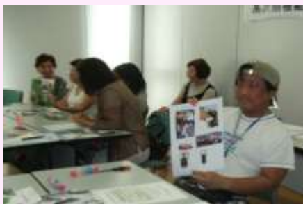
「欲しいもの、好きなものです」