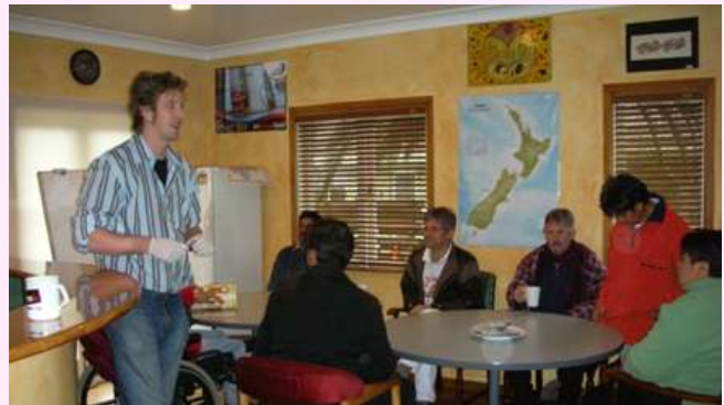
スチュワートセンター、休憩時間のリビング

日本の4分の3ほどの国土に400万人の人口、雄大な自然に恵まれた美しい国です。障害者権利条約を推進してきたこの国は、一方では、90年代には行財政改革を成功させたことでも知られています。このことで脳損傷者支援が厳しさにさらされることはなかったのでしょうか。その疑問に答えるのが、この国が誇る事故補償制度 (ACC) です。