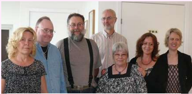
理事たちのほとんどは脳損傷の当事者

このサービスの査定がされると必要に応じて、グループホームの入居、パーソナルアシスタント、デイケアへの通所等々のサービスが使えます。特に脳損傷者へのパーソナルアシスタントの重要性について口を揃えて語られました。