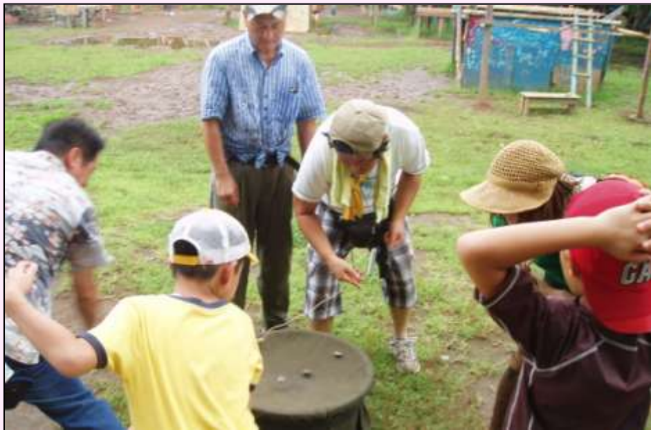
福島の子どもたちとあそぼう (関連 P6)