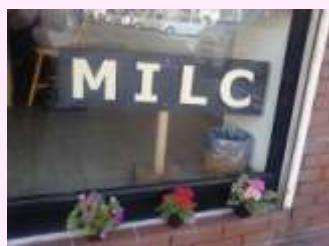
ショーウインドー